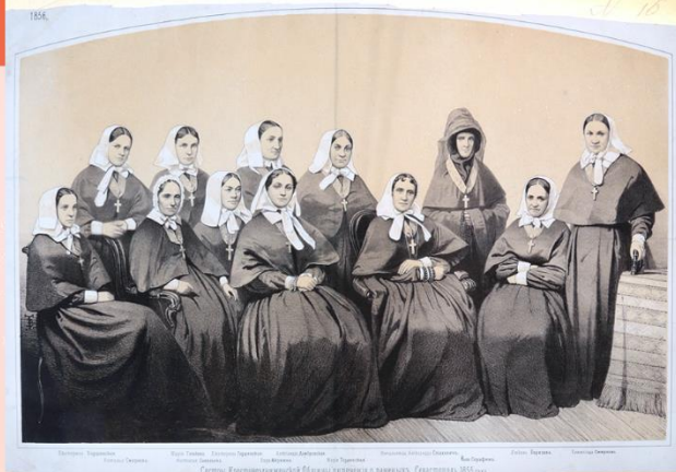
На фото: Сестры милосердия Крестовоздвиженской Общины. Севастополь, 1855 год.

Эти женщины выполняли почти ту же работу, что и санитары – помогали врачам и обеспечивали уход за ранеными