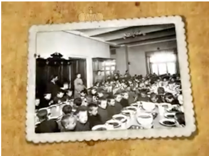
2Д ролик. Волонтер – это...