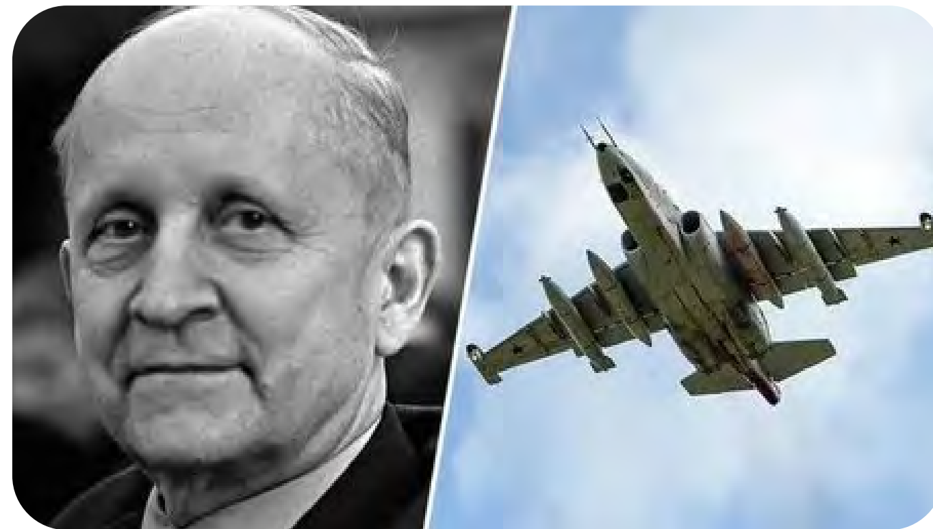
Павел Осипович Сухой — советский авиаконструктор, доктор технических наук, один из основателей советской реактивной и сверхзвуковой авиации