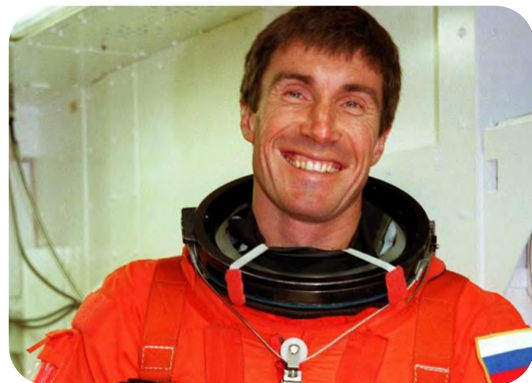
Сергей Константинович Крикалёв — советский и российский авиационный спортсмен и космонавт, лётчик-космонавт СССР, обладатель рекорда по суммарному времени пребывания в космосе (803 дня за шесть стартов)