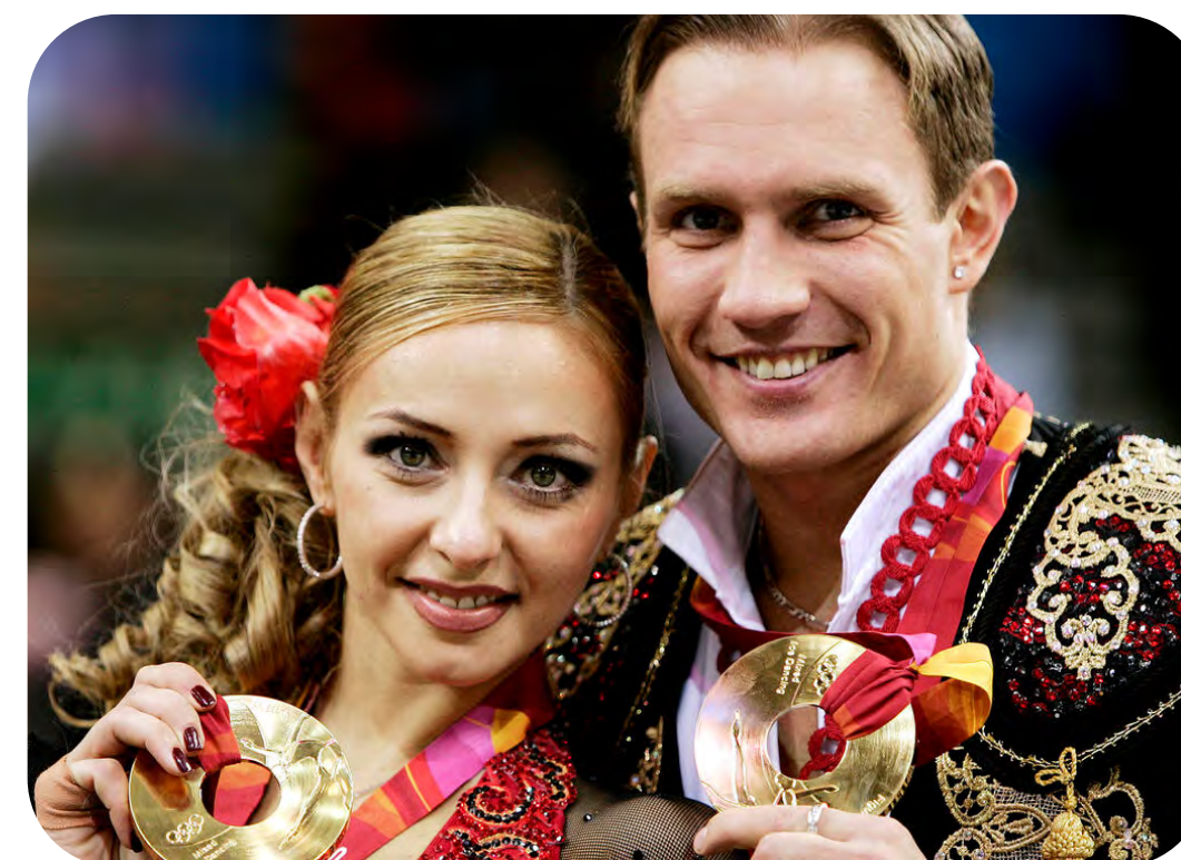
Татьяна Навка и Роман Костомаров