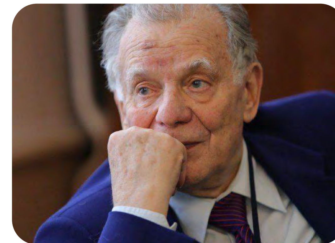
Жорес Иванович Алфёров — физик полупроводников, академик АН СССР, академик РАН, лауреат Нобелевской премии по физике (2000)