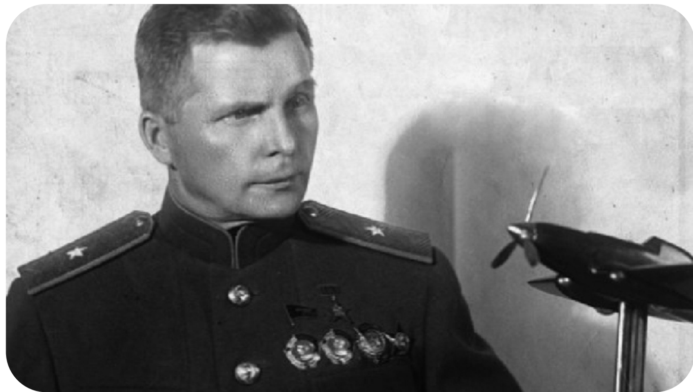
Сергей Владимирович Ильюшин — советский авиаконструктор, разработчик самого массового боевого самолёта в истории — штурмовика Ил-2