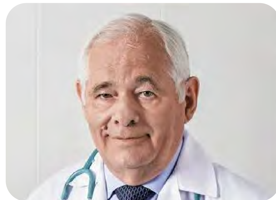
Леонид Михайлович Рошаль — советский и российский хирург, общественный деятель