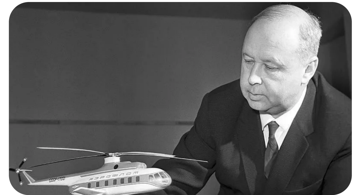
Михаил Леонтьевич Миль — советский конструктор вертолётов и учёный, доктор технических наук