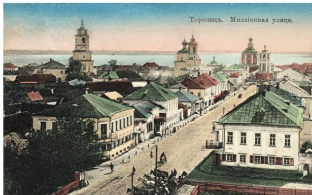
Торопец, Миллионная улица

Ответ: на ней жили богатые купцы, и сам город был купеческим. Сейчас эта улица называется Советская, на ней немало добротных, сохранившихся купеческих особняков, которые до сих пор являются жилыми.