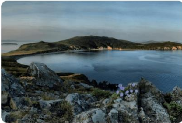
Остров Приморского края