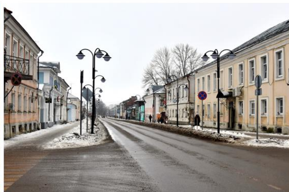
Торопец, Советская улица

Учитель. Торо́пец – старинный купеческий город, и познакомиться нас поближе с его купеческим прошлым уже спешит купец Торо́пец