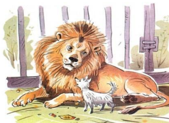
Лев и собачка

Задание: соотнеси название сказки с иллюстрацией.