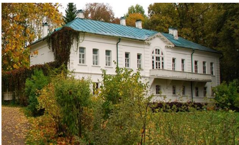
Фотография. Здание школы для крестьянских детей в Ясной Поляне