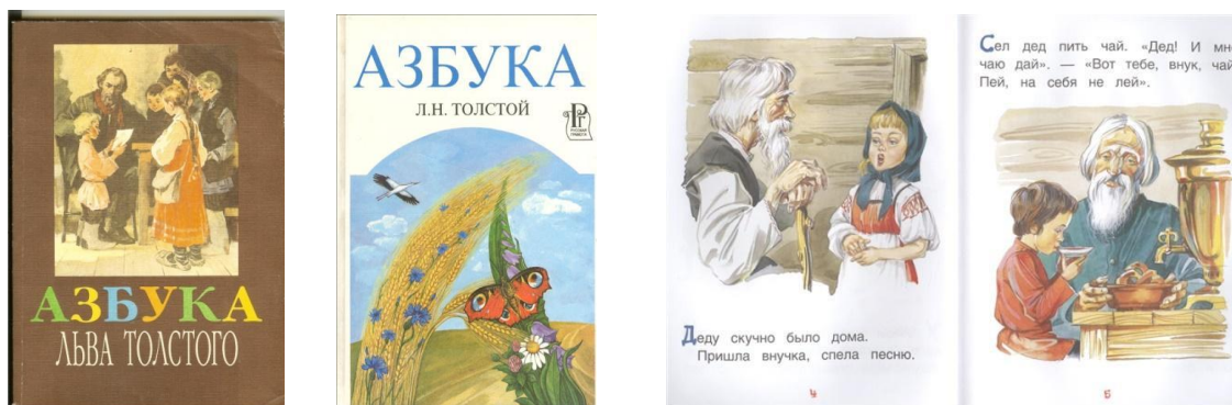
Фотография. Страницы «Азбуки» Л.Н. Толстого