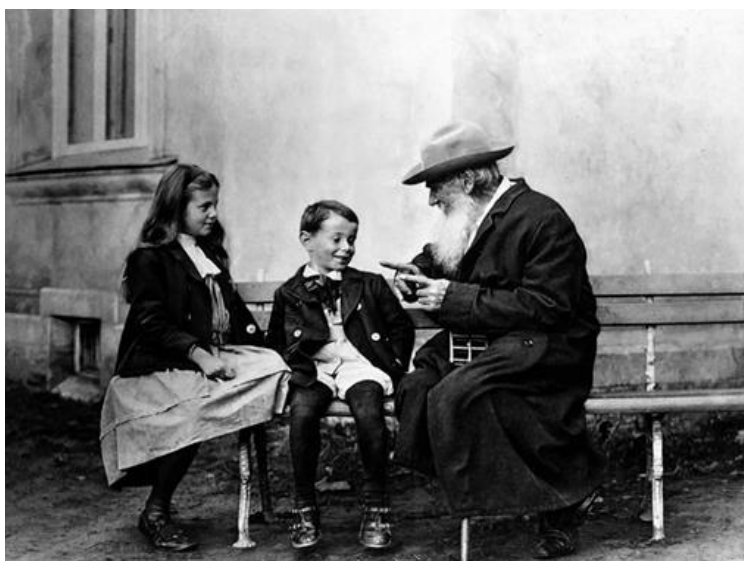
Фотография. Л.Н. Толстой и ученики Яснополянской школы