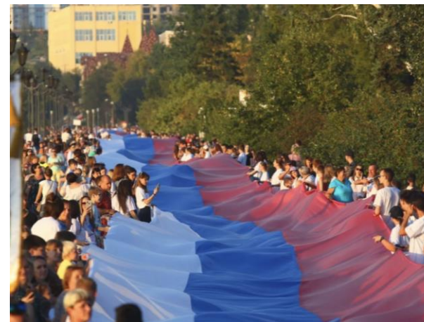
Флаг России в рекордах