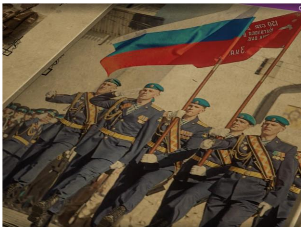
2D-ролик, История флага России