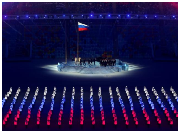
Значение флага России