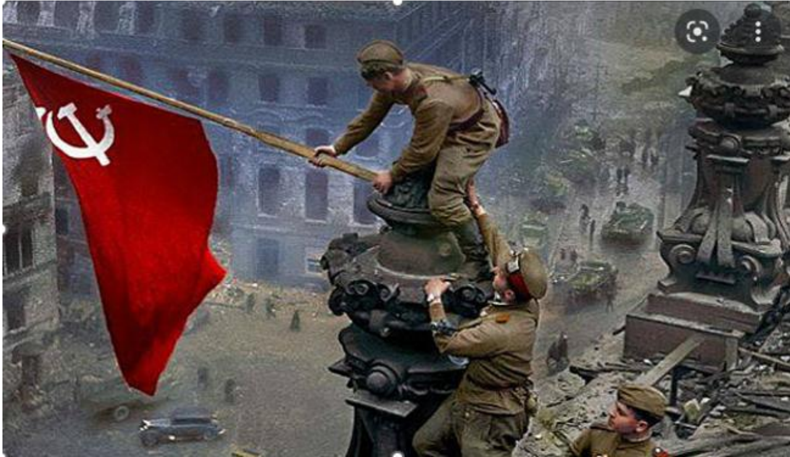
Знамя Победы над Рейхстагом