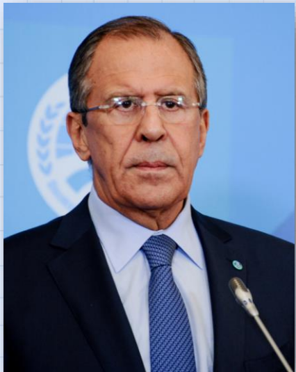
С. В. Лавров

«Процесс построения именно многополярного миропорядка, более демократичного, более честного, справедливого для большинства человечества просто неизбежен, исторически необходим»