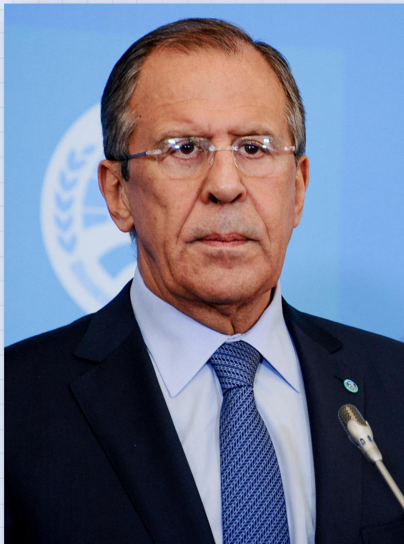
С. В. Лавров

«У нас нет недружественных стран и нет недружественных народов. Есть правительства, которые от имени государства принимают решения, которые мы расцениваем как недружественные»