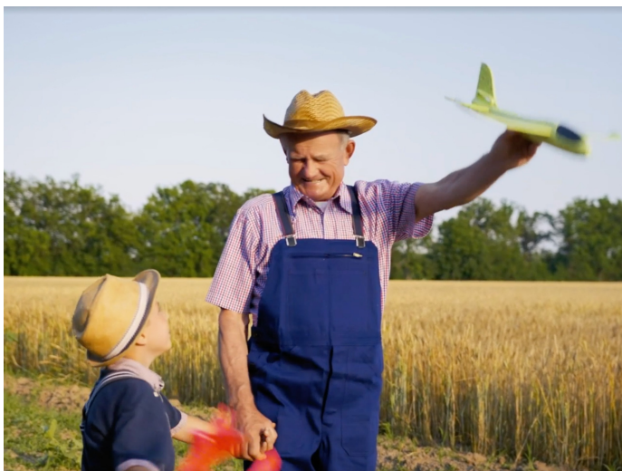
2D-ролик «Связь поколений» о ценности отношений и уважении к старшим