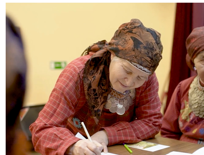
«Бурановские бабушки» о том, как можно помогать старшим и как это важно