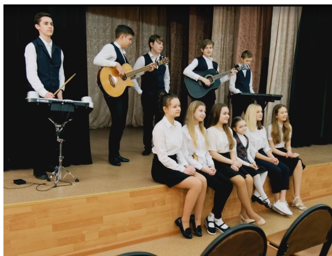
«Сохранение исторической памяти» о значении памяти, о событиях в Челябинской области во время ВОВ