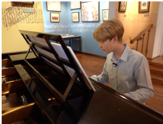
«Великие русские композиторы»