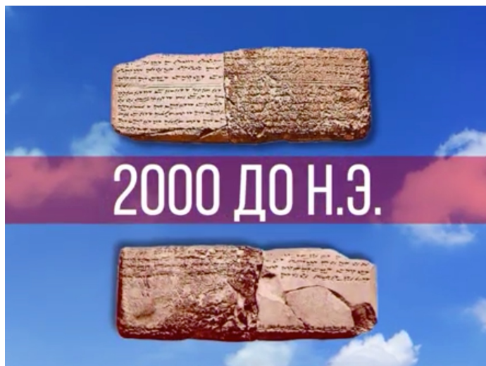
2d-ролик «Об истории музыки»