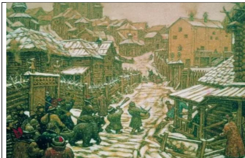
«Медведчики (развлечение). Старая Москва». А. Васнецов

Раньше путешественники всегда вели дневники, в которых ежедневно записывали свои впечатления и увиденное в России. И их всегда удивляла морозная, снежная зима, а ещё поражала крепкая связь с медведем. Всем известно, что в старину ни одна ярмарка в России не обходилась без представления скоморохов с медведем. Вот как это изобразил художник на картине.