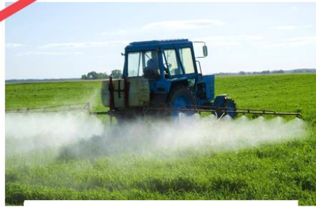
Инженер по орошению

Специалист, который проектирует и обслуживает системы полива и орошения для сельскохозяйственных культур