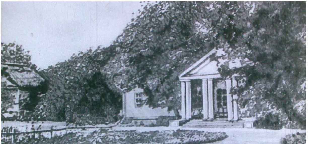
Усадьба родителей Н.В. Гоголя в селе Васильевка