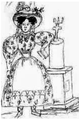
Рисунок Н.В. Гоголя из «Книги всякой всячины»

В Санкт-Петербурге. Знакомство с А.С. Пушкиным