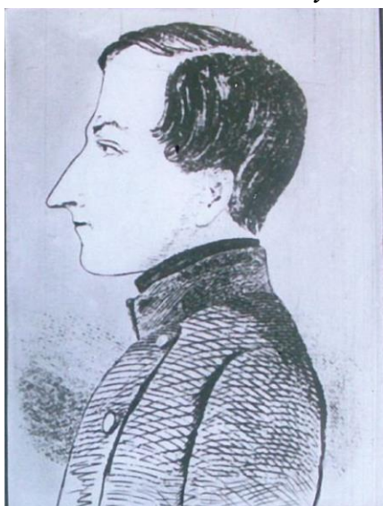
Неизвестный художник. Гоголь-гимназист

Любимыми предметами будущего писателя были рисование и русская словесность. Он восхищался творчеством Александра Сергеевича Пушкина. Например, один из романов перечитывал столько раз, что выучил некоторые главы наизусть. Во время обучения в гимназии Николай Гоголь продолжает