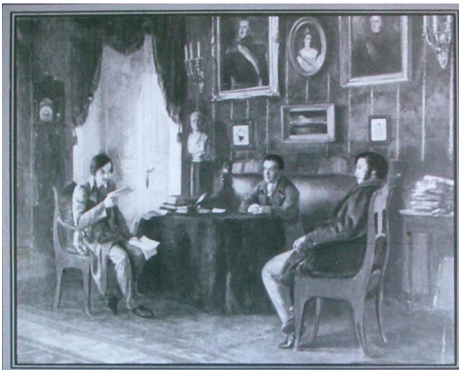
А.С. Пушкин и Н.В. Гоголь в Царском Селе. 1831 г. (художник П. Геллер)

После окончания гимназии молодой Николай Гоголь едет в Петербург. Ему нравится сочинять, он чувствует в себе писательский талант, но пока он не до конца уверен, что станет литератором. Гоголь мечтает о прекрасном деле, какое он призван совершить, о важном, благородном труде на пользу отечества, для счастья людей. По его словам, ему хочется сделать что-то важное для общего добра. Он попробует себя и как преподаватель, и как чиновник и постепенно понимает, что истинное его призвание – это литература, и его служение Родине его творчество. Отправляясь в Петербург, Гоголь, конечно, мечтает познакомиться со своим кумиром – Александром Сергеевичем Пушкиным, но происходит это не сразу, а в 1831 году. Пушкин почувствовал талант молодого Гоголя, оценил его живой ум, ему очень понравилась первая книга Николая Гоголя. Частые встречи с Пушкиным очень помогли становлению Гоголя как писателя.