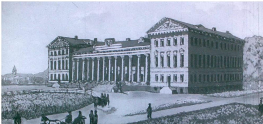
«Гимназия высших наук» в г. Нежин

В течение семи лет Николай Васильевич Гоголь учился в «Гимназии высших наук» в городе Нежин.