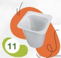
Стаканчик от йогурта