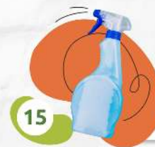
Бутылка от чистящего средства