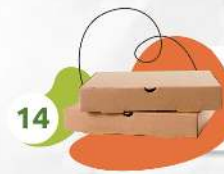
Коробка от пиццы