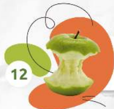
Огрызок от яблока