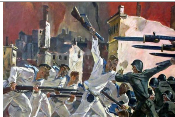
А. Дейнека. Оборона Севастополя (фрагмент)

Рождение Красной Армии или Первый бой с немцами под Псковом 23 февраля 1918 г. (фрагмент картины)