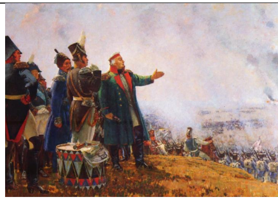
С. Герасимов. Кутузов на Бородинском поле