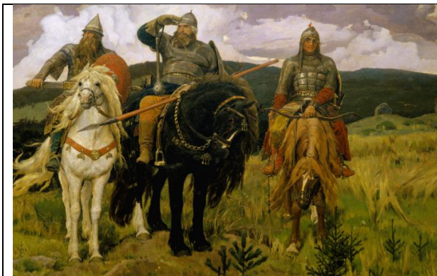
В. Васнецов. Три богатыря