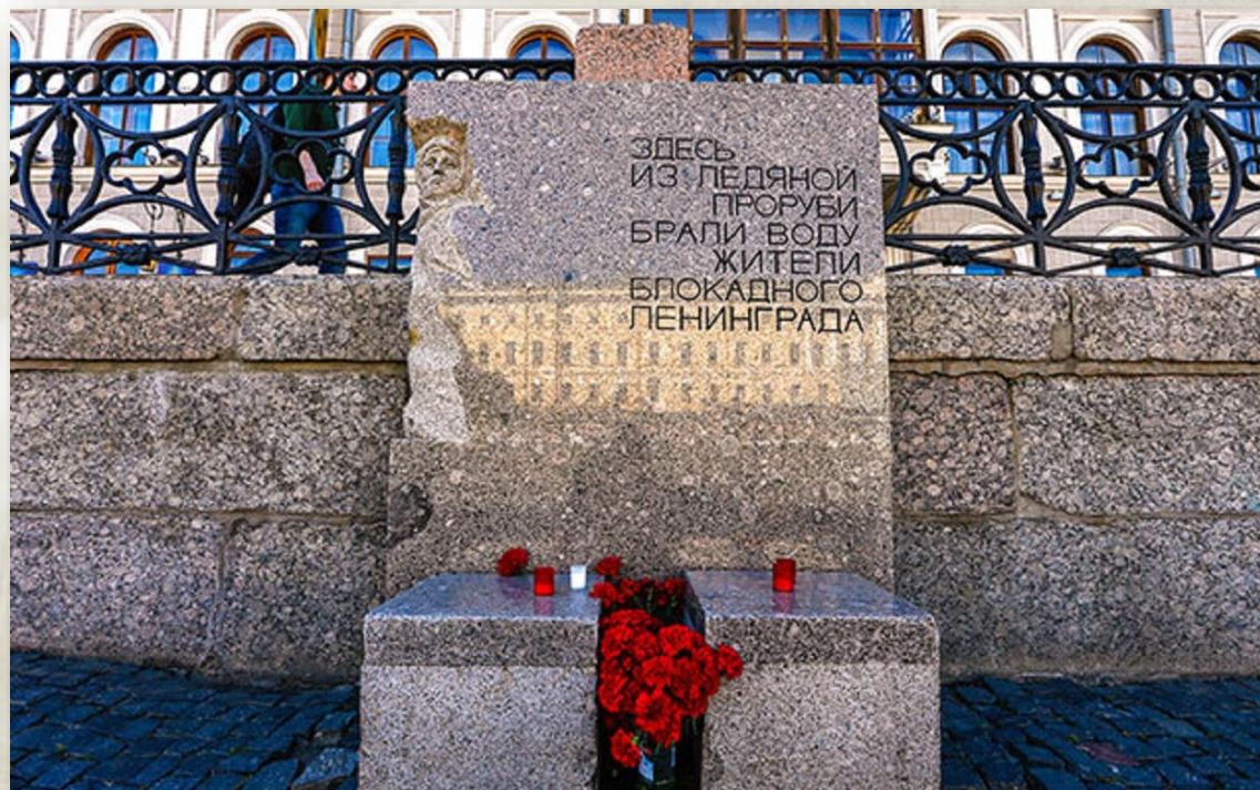
Блокадная прорубь Фонтанка, 21