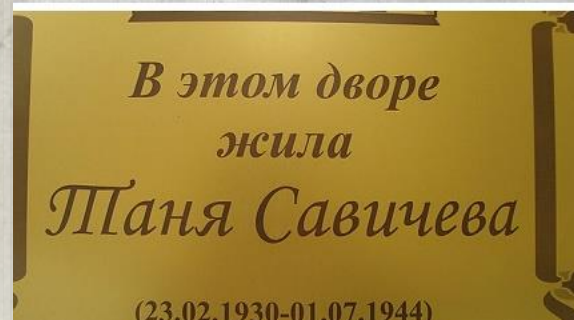
Дом Тани Савичевой, 2-я линия В.О., 13/6