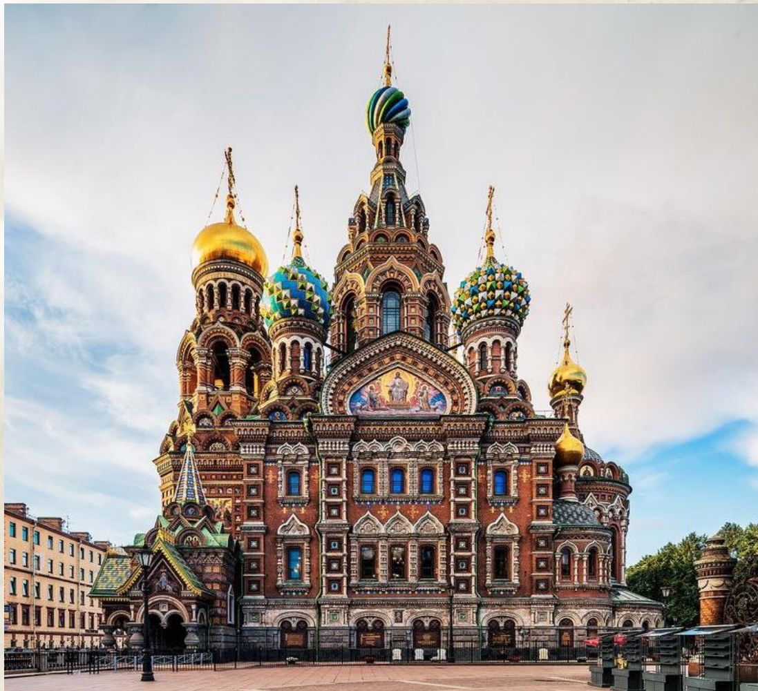
Спас - на - Крови