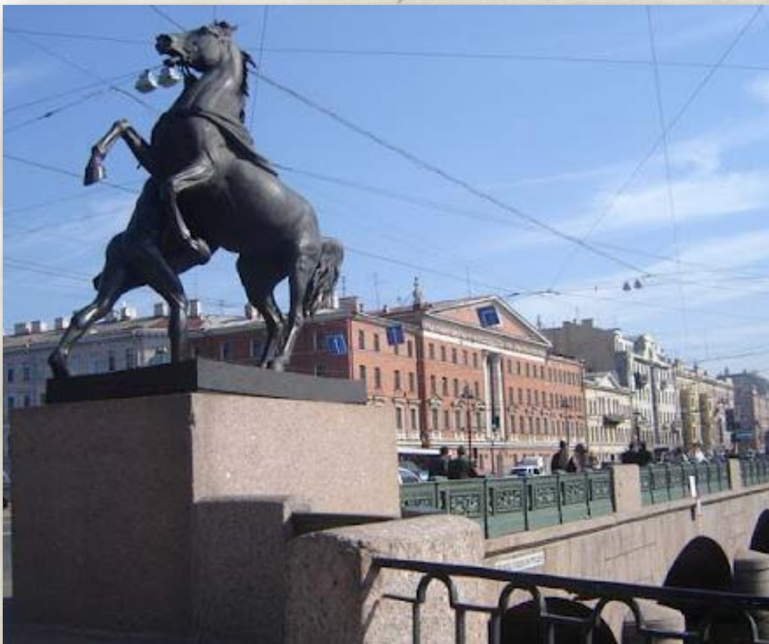
Аничков мост, Невский проспект