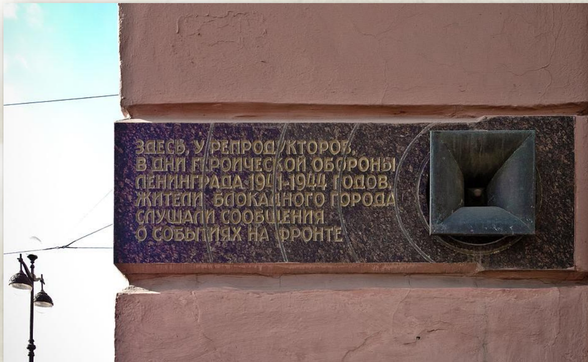
«Блокадный репродуктор» угол Невского проспекта 54/3 и Малой Садовой улицы