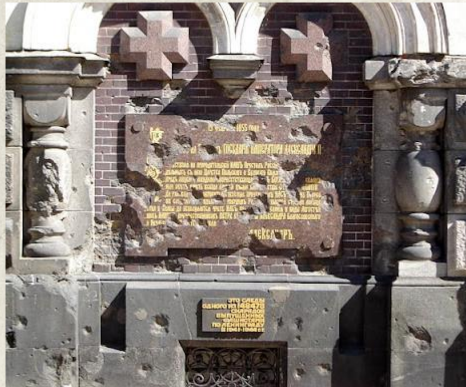
Следы от снарядов