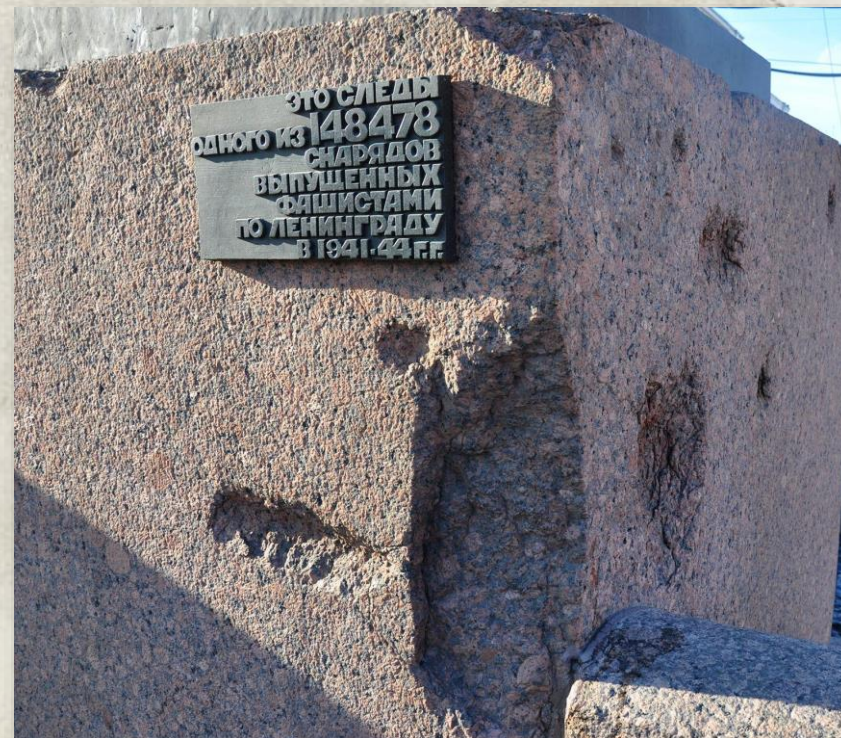
Следы от снарядов