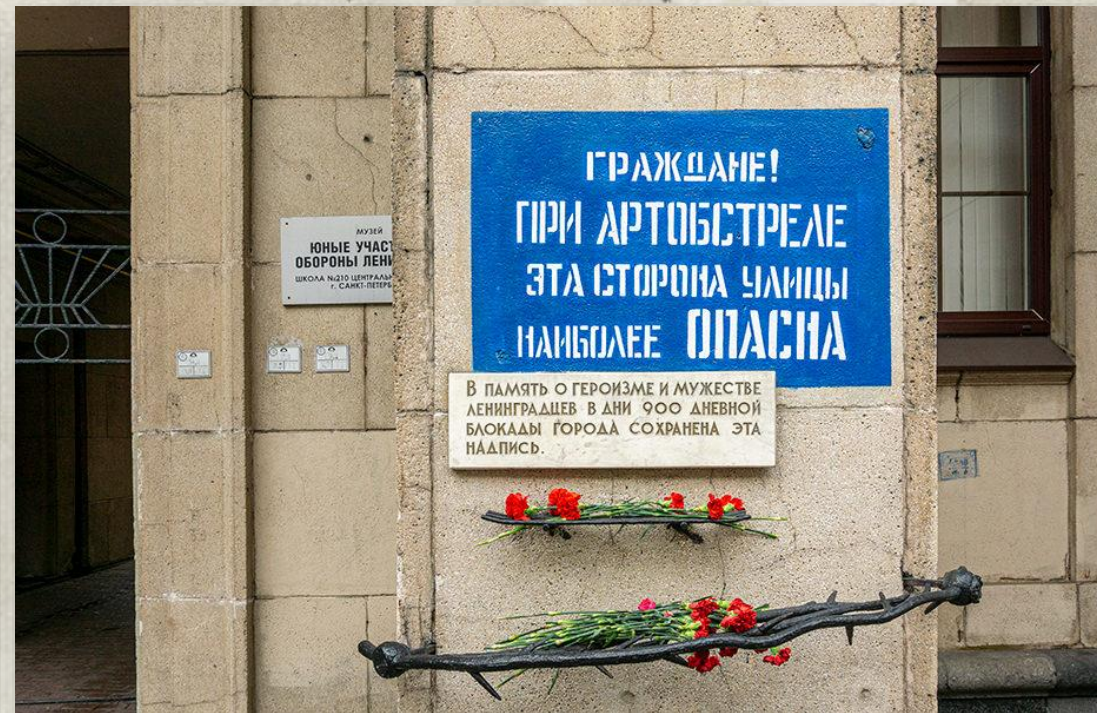
Табличка «Опасная зона» Невский проспект, 14